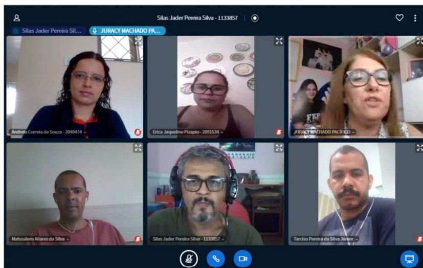
Figura 2: Integrantes dos grupos de pesquisa: EDUCA/UNIR e GEPEIN/UNIR e participantes do Seminário APE I